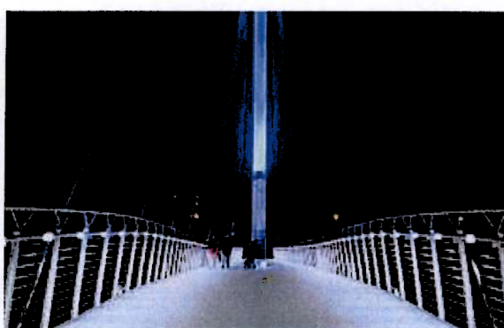
(bilder for insp. til gamle-Bogfjellmo bru)