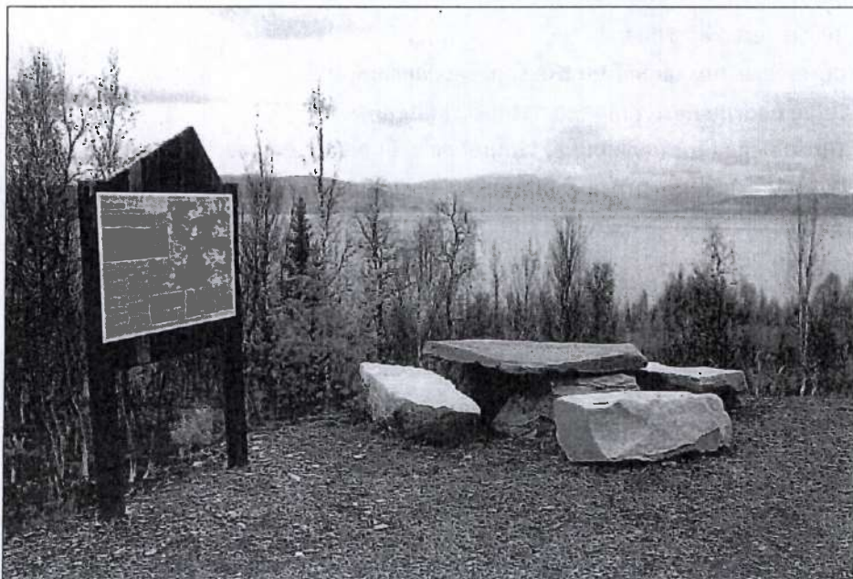
Rasteplass ved Varntreskeveien, Røssvatn

Oppgaver: Bedre allmenn tilrettelegging av natur- og kulturelementer Gjennomføre skilting i henhold til parkens skiltplan Koordinere oppfølging av Regional plan for Vefsna