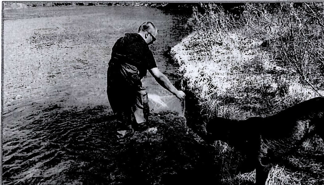
Yngelutsetting i Vefsna