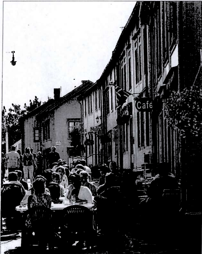
Fra Galleria i Sjøgata

Oppgaver: Utvikle regionens kultur og ta i bruk kulturminner som verdifulle ressurser i lokal verdiskaping Bistå og videreutvikle kulturarrangementer i tråd med parkens formål