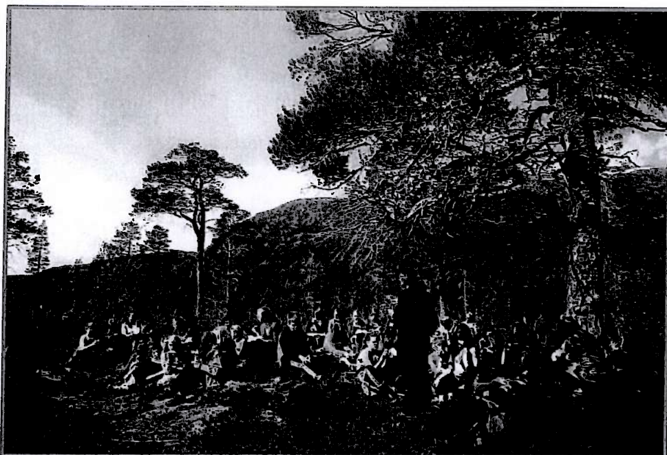
Elevtur med undervisning i lokal natur/kulturhistorie