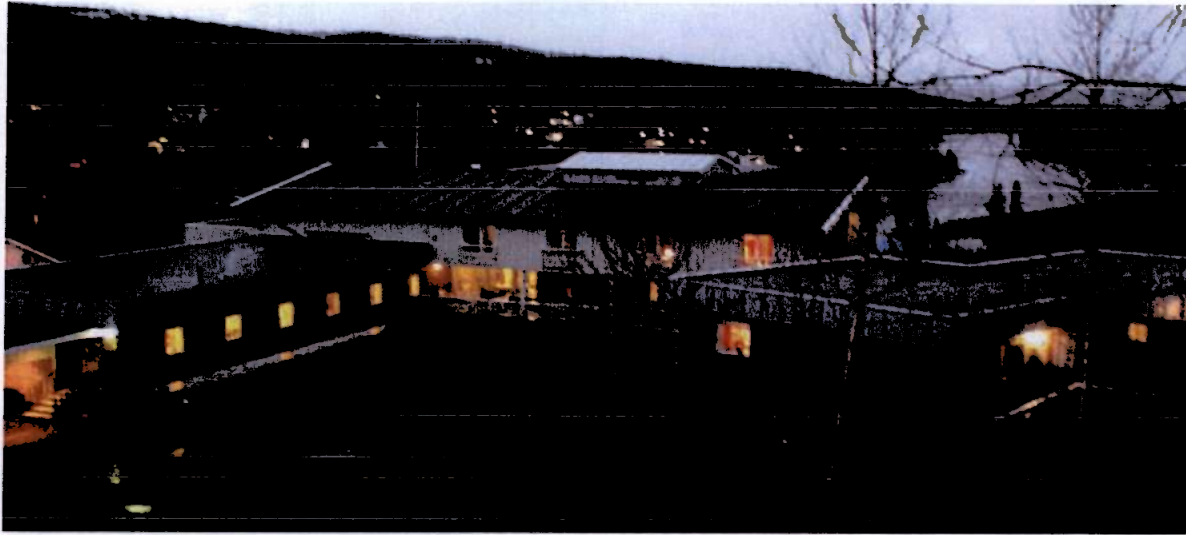
Figur 10: Foto fra tomt 0, dagens sykehjem. Tomta anbefales ikke for nytt sykehjem med tilleggsfunksjoner.