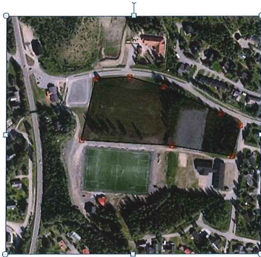
Reguleringsplan Stormoen I fra 1979.

Området skal dekke funksjonene for barnehage, førskole og barneskole/ungdomsskole. De enkelte tomters bruk og funksjon fremgår av tekst på planen. Bebyggelsen kan oppføres i 1 etasje. Bebyggelsens art og utforming, beplantning, lekeområde, innhengning m.v. skal i hvert enkelt tilfelle godkjennes av bygningsrådet. Bygningsrådet kan kreve utarbeidet bebyggelsesplan for området i sin helhet, eller deler av det får anmeldelsen av et enkelt bygg behandles.