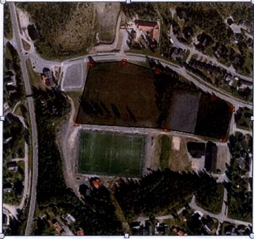
Reguleringsplan Stormoen I fra 1979.