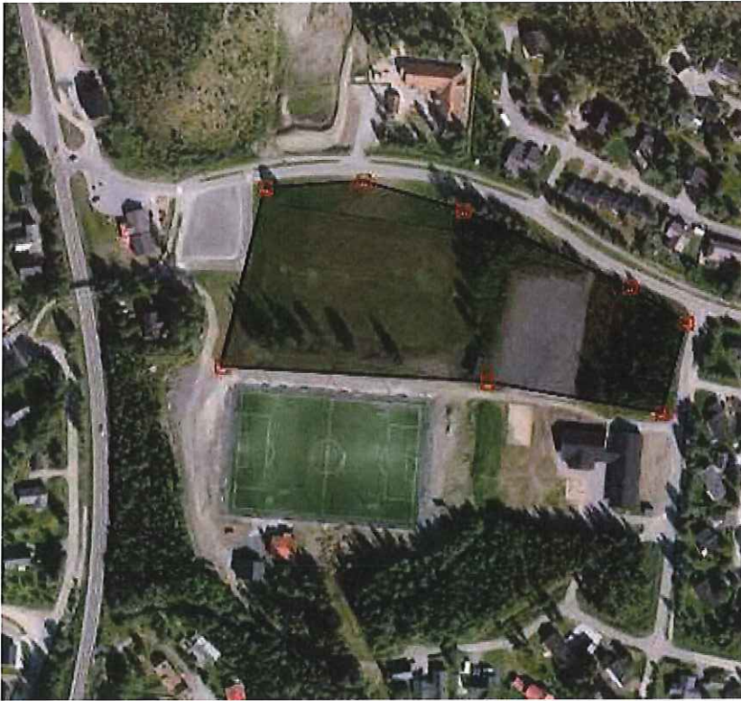
Reguleringsplan Stormoen I fra 1979.